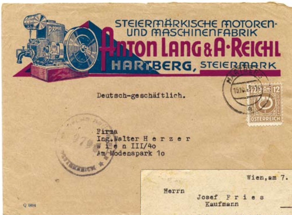
◀ Einer der Wirtschaftsmotoren der Nachkriegszeit.

Heimkehrer, 50 J. sucht Posten als Platzmeister, Inkassant, Mitfahrer od. Diener, infolge beruflicher Kenntnisse sehr vielseitig verwendbar. Unter „9494“ a.V.